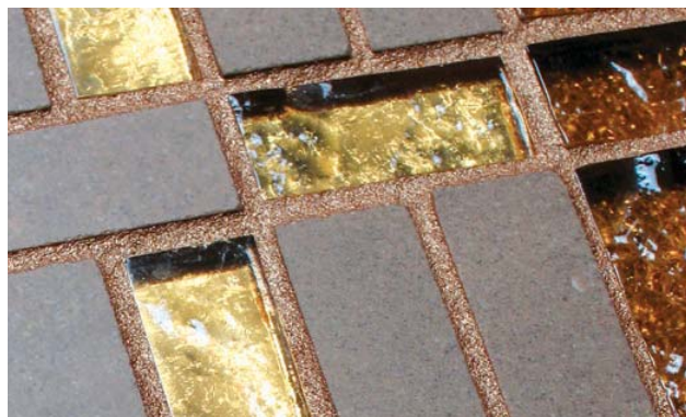
С рекомендуемыми сочетаниями STARLIKE и декоративных добавок STARLIKE FINISHES можно ознакомиться на странице 231.